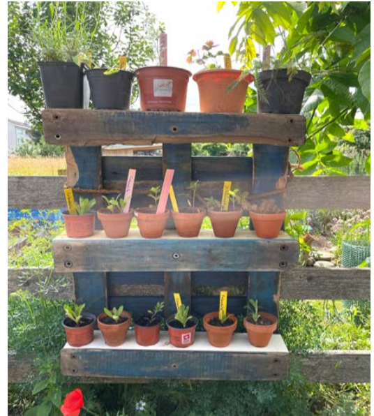
Tage der Nachbarschaft, 31. Mai – 1. Juni: 150 Pflänzli zum Mitnehmen für die Leute im Quartier