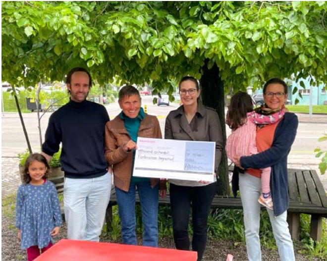
Preisübergabe Raiffeisen, 6. Mai