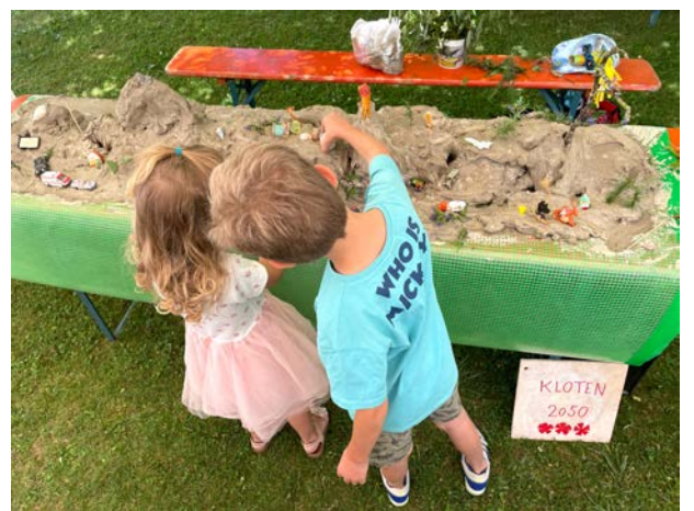
Mit Farbe und Lehm die Welt neu gestalten.