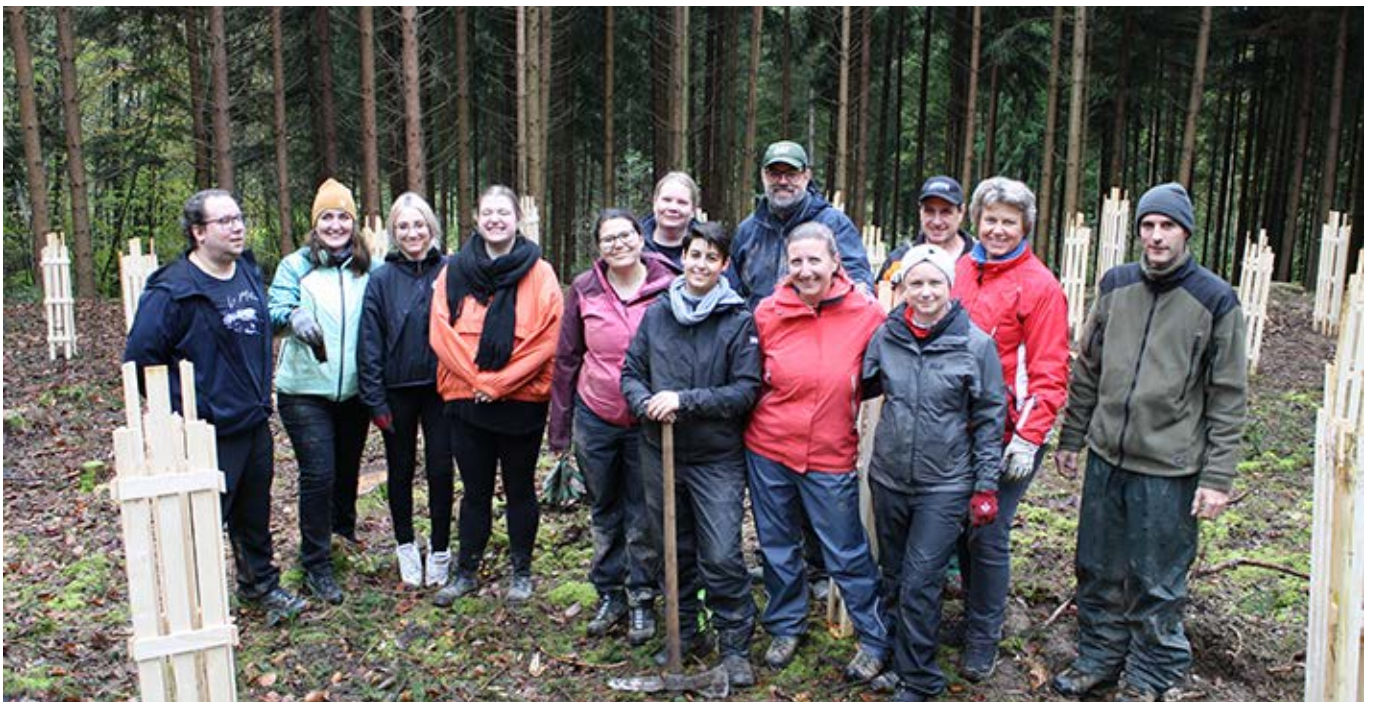
Mitarbeitende der DHL Logistics Ltd. Kloten pflanzen am 5. Nov. 160 Bäume im Schlattwald.