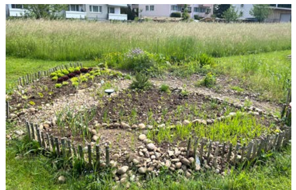
Interkulturelle Vielfalt: Die 10 Gartenrund werden nach eigenem Bedarf gestaltet und gepflegt.