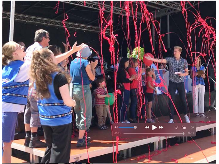
1. Preis an der Landsgemeinde