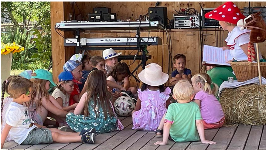
Geschichten, Musik, Theater und Performance für Erwachsene und Kinder